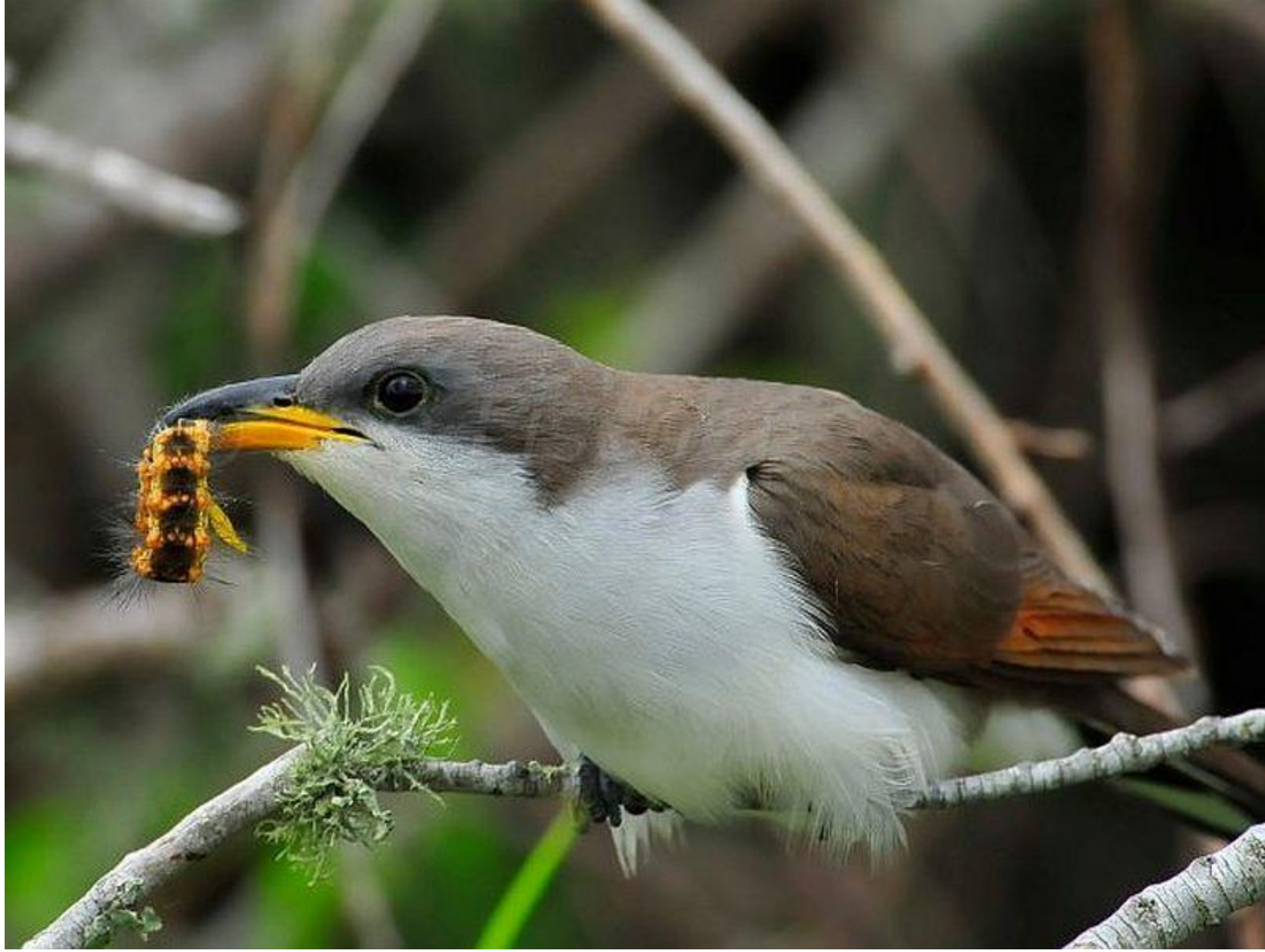
Foto 7: Sekundárni konzumenti