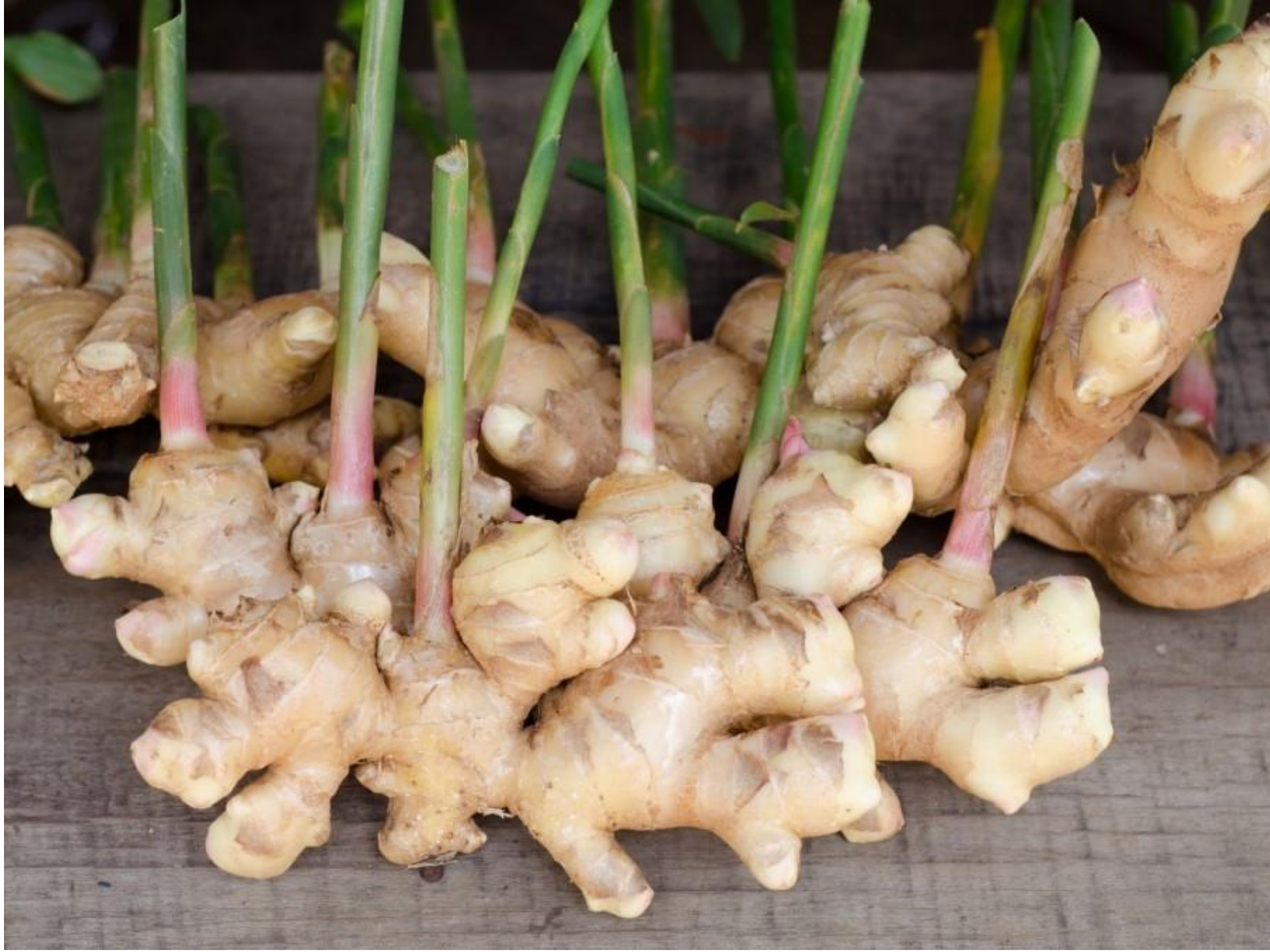
Foto 1: Metamorfoza stonky – podzemok (Ďumbier lekársky)